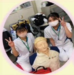
終了後に記念撮影