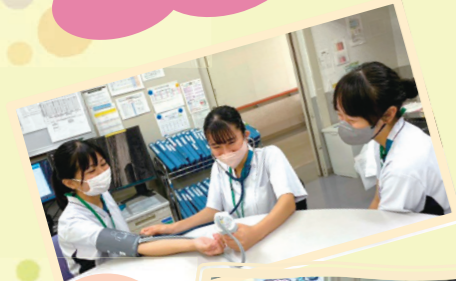
血圧測れているかな？