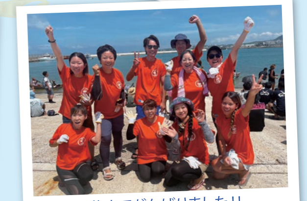
最後までがんばりました!!