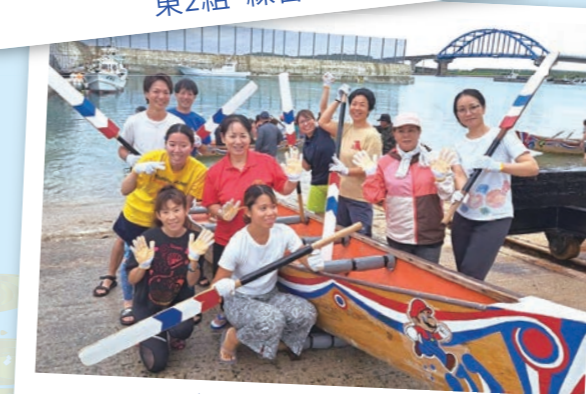
チーム団結力あり!!