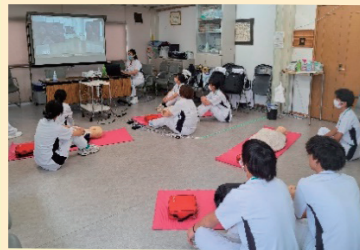
BLS：真剣に聴いています