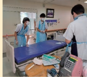
ベッドメイキング説明を受けながら実施しました