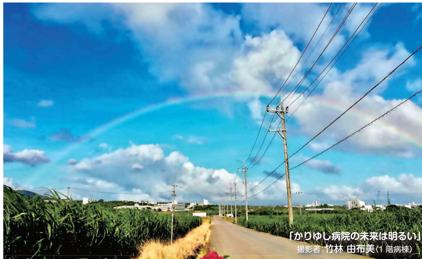
「かりゆし病院の未来は明るい」 撮影者：竹林 由布美(1階病棟)